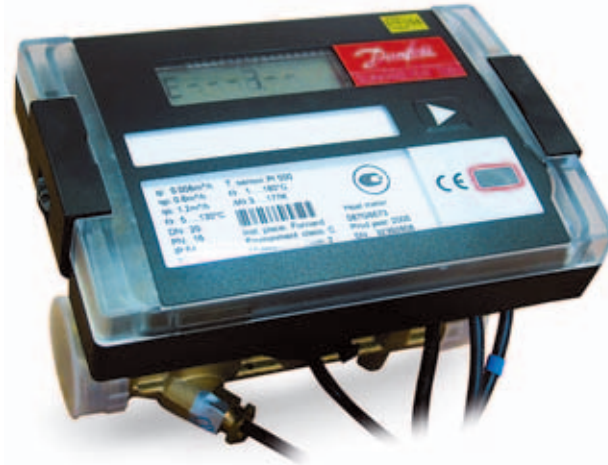
Компактный теплосчетчик SONOMETER 1000

Все теплосчетчики типа SONOMETER стандартно оснащены оптическим инфракрасным интерфейсом, который используют для связи с компьютером при считывании данных из архивов, а также при работе с программой конфигурации счетчика.