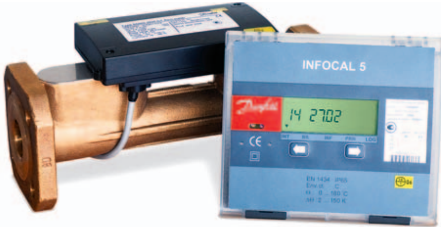
УЗТ SONOMETER 2000 с тепловычислителем INFOCAL 5 OS

Расходомер может быть установлен как горизонтально, так и вертикально. Но не должен быть размещен в местах системы, где возможно скопление воздуха внутри корпуса, так как это отразится на его работе.